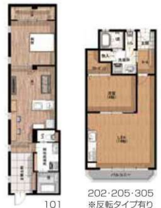
101 202・205・305 ※反転タイプ有り