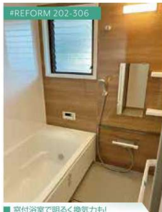
#REFORM 202-306 ■ 窓付浴室で明るく換気力も！