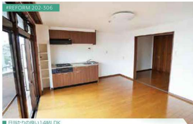
#REFORM 202-306 ■ 日当たりの良い14帖LDK