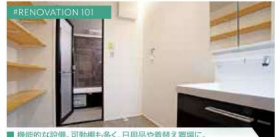
#RENOVATION 101 ■ 機能的な設備。可動棚も多く、日用品や着替え置場に。