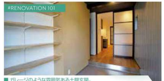
#RENOVATION 101 ■ ガレージのような雰囲気ある土間玄関。